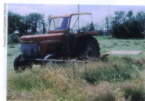
Les barres d'envol déjetées sur le côté ont une efficacité certaine, mais elles constituent une gêne. Le chauffeur doit veiller à limiter la vitesse.

Il faut conserver au contraire un grand espace entre deux engins s'ils travaillent dans le même champs et dans le même sens.